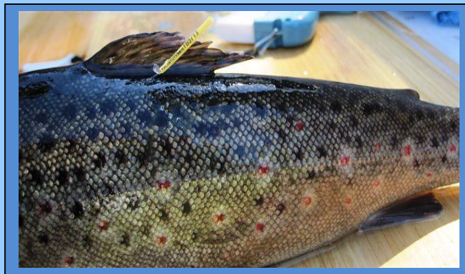
ankkurimerkillä merkitty taimen