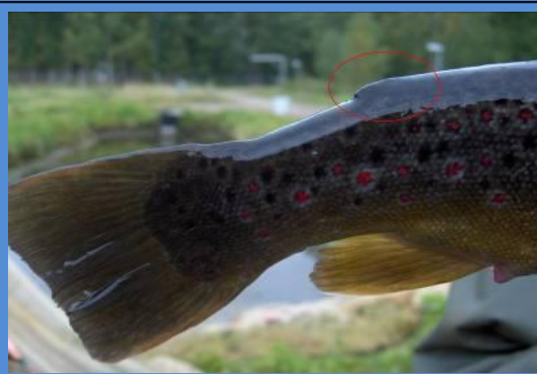
Eväleikattu istukastaimen

Vuoden 2016 alusta alkaen on rasvaevällinen taimen kalastusasetuksella rauhoitettu leveyspiirin 64 eteläpuolella. Sääntö koskee siis myös Päijänteen vesistöä.