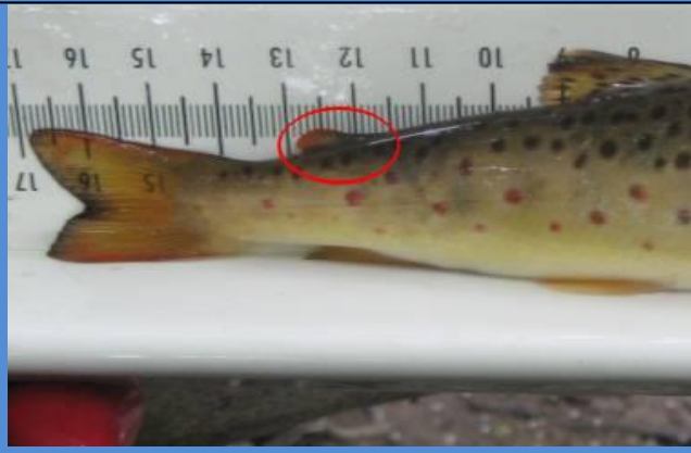
Rasvaevällinen luonnonkala