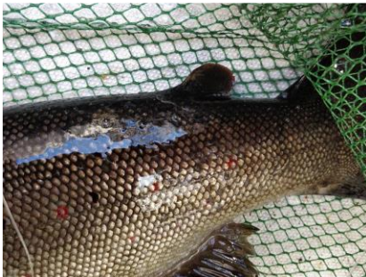
Rasvaevällinen taimen (luonnonkala)