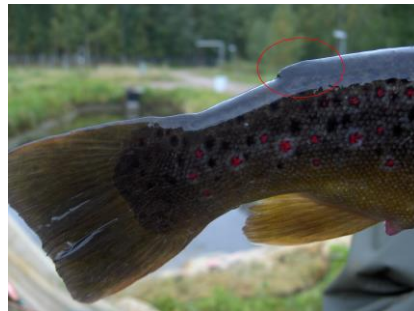
Eväleikattu taimen (istukas)