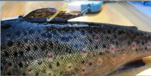
Ankkurimerkillä merkitty taimen

Päijänteen vesistöissä merkitään taimenia T-ankkurimerkein. Merkinöillä seurataan taimenten vaellusta ja kannan tilaa. Merkitä kirjoitetaan ylös koodi. Liitä koodin tiedot, kuten pyyntipaikka, paino ja pituus. Koodit voi lähettää postimaksutta osoitteeseen: LUKE, Merki, 5005751, 00003 VASTAUSLÄHETYS Lisäohjeita saat internetistä osoitteesta https://lomakkeet.luke.fi/kalamerkki