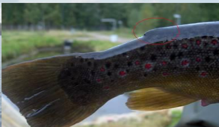
Eväleikattu taimen (istukas)

Vuoden 2016 alusta on rasvaevällinen taimen kalastusasetuksella rauhoitettu leveyspiirin 64 eteläpuolella. Sääntö koskee siis myös Päijänteen vesistöä.