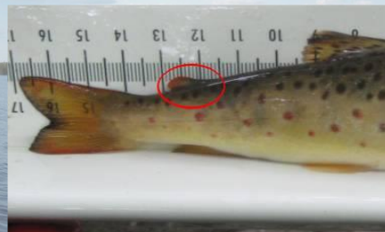
Rasvaevällinen taimen (luonnonkala)